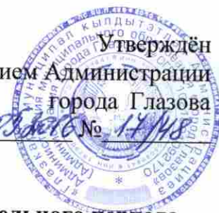
ГРАФИК заседаний комиссии по подготовке и проведению отопительного периода 20165 – 2017 года в муниципальном образовании «Город Глазов»